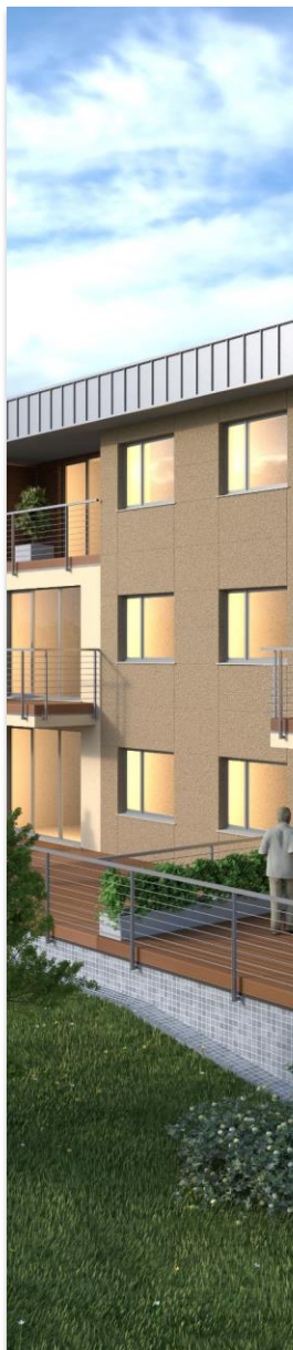
Osiedle Miłe Zacisze II