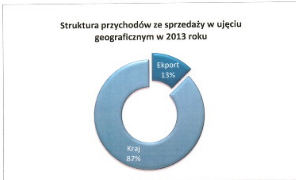
Rysunek 3. Struktura geograficzna przychodów.

Rentowność sprzedaży netto w prezentowanym okresie, w porównaniu z latami ubiegłymi przedstawia poniższa tabela: