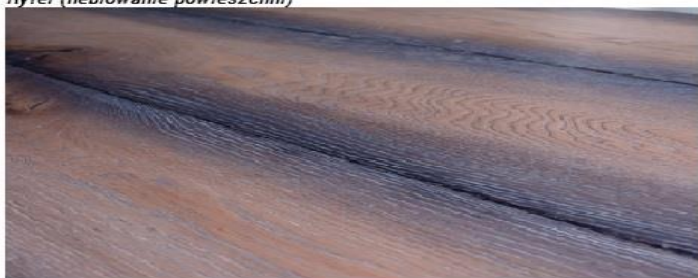
Ryfel (heblowanie powieszchni)