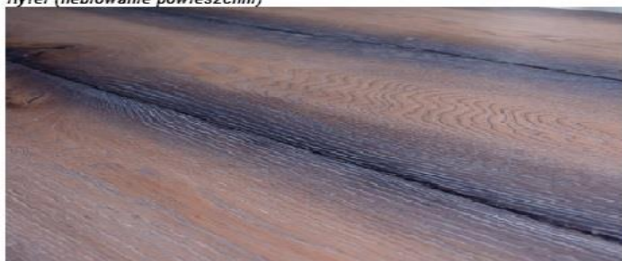
Ryfel (heblowanie powieszchni)