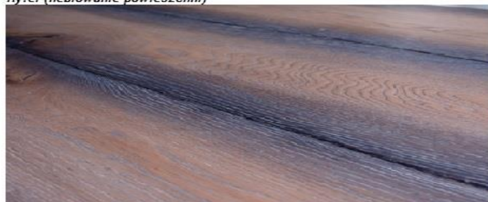
Ryfel (heblowanie powierzchni)